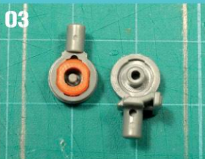
03 前手臂与手掌关节零件，手部嵌合。