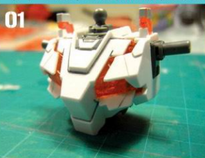
01 胸部前后部分组合。