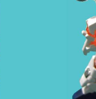
组装上武装配备。宣告完成！