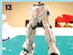
13 下半身与上半身嵌合。