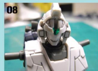
08 嵌入天线的凹部分也要注意方向，凹部是向前面，接着嵌入天线。