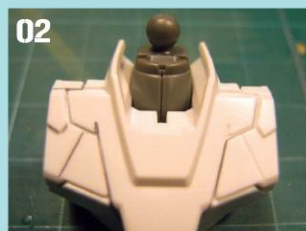
02 把组件嵌进胸部旁，每组完一个部分就可以顺着配件上的凹槽画线。用灰色的勾线笔勾完擦拭一下，淡淡的即可，有阴影的感觉就行了。