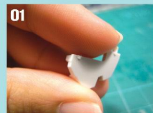
01 前胸组件：把零件从框架上剪下，用笔刀切修后，以水砂纸打磨留下的接口痕迹至组件表面平整光滑。

废话少说，进入正题吧！首先要紧记的有3个步骤。1)用模型钳剪下部件并保留3mm左右的一小段接口。2)用刀片切修接口时不要一下子就切到部件，而是保留一点接口。3)用水砂纸打磨。如此，就会达到模型表面平滑一致的效果。