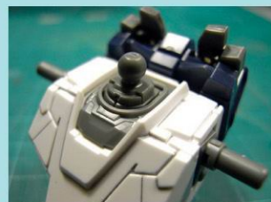
06 头部的组合，在这里要注意组件的左右之分。