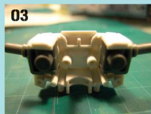
03 胸部后部分：把关节嵌入后胸部的内部。