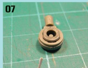
07 手肘的关节零件，要注意的是这零件的正确嵌入位是向直的椭圆形。