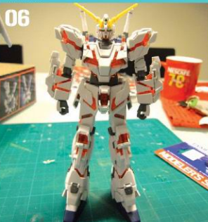
06 上半身与下半身各完成部分。