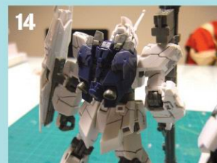
14 将武装配备全装上。正式完成！！