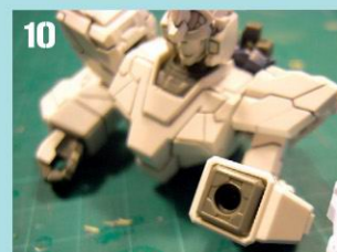
10 完成前后裙甲部分。