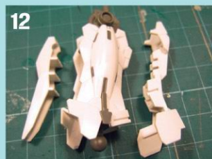
12 大腿部分，与脚部组合。