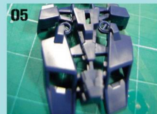
05 用来飞行和跳跃的火箭推进器组件，照次序组合后与胸部部分嵌合。